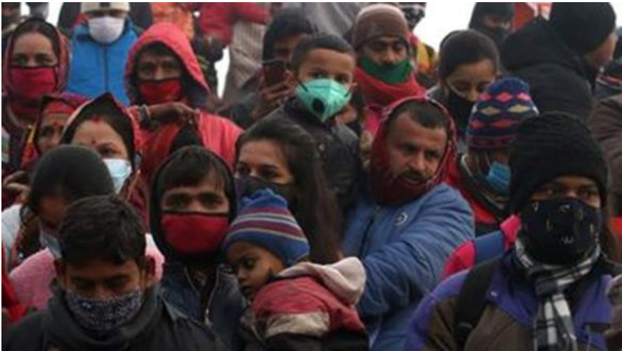
Hindoes op weg naar de Ganges