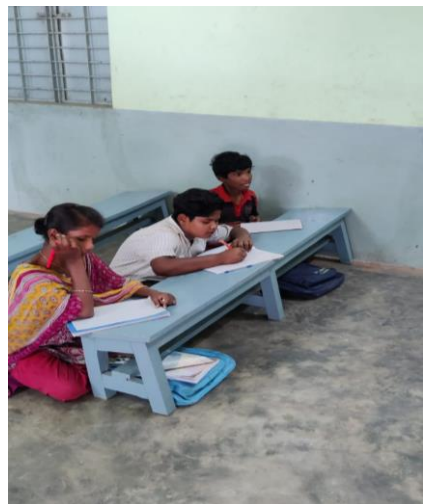
Kinderen in de huiswerk klas

Online studeren is niet makkelijk, van werken op de mobiele telefoon kreeg ik pijn aan ogen en vingers. Ik kon de online lessen volgen, maar alles was makkelijker toen we nog gewoon les in de klas hadden en direct contact met de docent. Ik miste de aanwijzingen van de docenten, hun aanmoedigingen en inspiratie en natuurlijk ook de vriendschap van mijn klasgenoten.