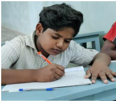
Hard doorwerken in de klas

Wij, de kinderen van Neerlagunta willen jullie een brief schrijven over onze ervaringen tijdens de lockdowns. We denken dat het voor iedereen een zware tijd is geweest. Bij ons waren de school en het huiswerk centrum gesloten. Een vader van een vriend overleed en we konden niet naar zijn huis. Thuis was er niet veel te doen en de verveling sloeg toe. We kregen wel online les maar dan is anders dan in de klas. Veel onderwijs is er langs ons heen gegaan. Als we weer naar school mogen, kunnen we onze vrienden weer zien, samen spelen en met onze docenten praten.