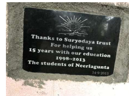
Een plaque uit dankbaarheid

verkopen om in hun levensonderhoud te voorzien langs een weg waar niemand komt. Ondanks alle armoede leken de mensen gelukkig en er het beste van te maken. Daar kunnen wij nog wat van leren. Kinderen die we ontmoetten waren erg dankbaar voor de kansen die ze door onze bijdrage krijgen. We werden er soms een beetje emotioneel van; zeker als je hoort dat deze kinderen zich willen inzetten voor verdere ontwikkeling van het dorp in plaats van alleen van zichzelf.