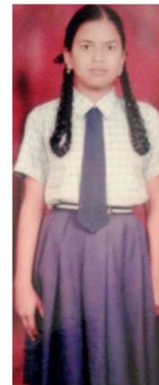
In uniform van de middelbare school