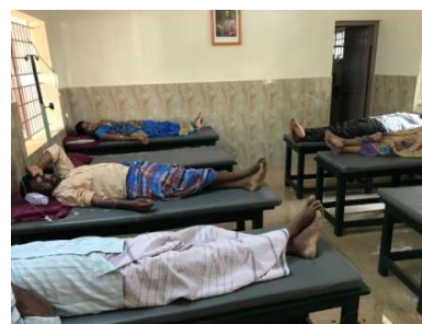
Het ziekenhuisje in Neerlagunta