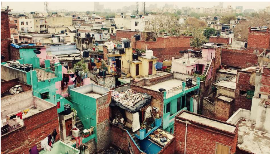
Sloppenwijk in Bangalore

schattingen om bijna de helft. De overheid kan de stedelijke groei niet bijhouden met de bouw van goedkope woningen voor de arme inwoners. Bovendien komen de goedkope woningen lang niet altijd overeen met de behoeften van de arme stadsbewoners. Vaak liggen ze in afgelegen buitenwijken, ver weg van de plekken waar inkomens worden verworven.