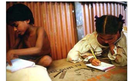
Kinderen maken hun huiswerk.